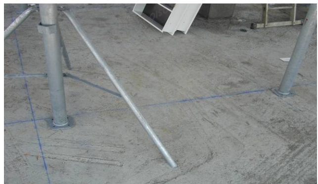
Foto abajo : desarme de paneles y vigas, mientras el puntal con cabeza de desarme rápido queda apuntalado hasta completamiento de la consolidación.

Foto abajo derecha : vista desde arriba de las vigas con cabeza de desarme rápido.